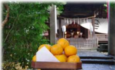
冬至祭で使用された一山神社のゆず